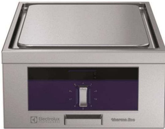
588005 (MALBACEOAO) Mono-Supertherm-Herd, 2 Zonen, ECOTOP-Beschichtung, beidseitige Bedienung